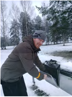
Kiitos kaikista joulumuistamisista ja korteista!