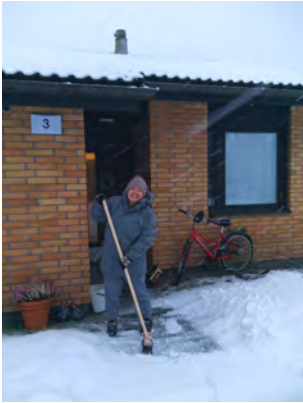
Välissä tulee lunta, räntää ja vettäkin.