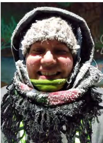
Tammikuun alkupuolella pakkasta oli Etelä-Suomessakin sen verran että ulkoillessa kuura koristeli ulkoilijat.

Onneksi me olemme perusluonteeltamme kotona hyvin viihtyvää lajia, joten rajoitukset eivät juurikaan perusarkeamme mullista. Ehkä sinne toimistoonkin joskus vielä päästään takaisin. Nyt kotitoimisto saa edelleen toimia työpaikkana.